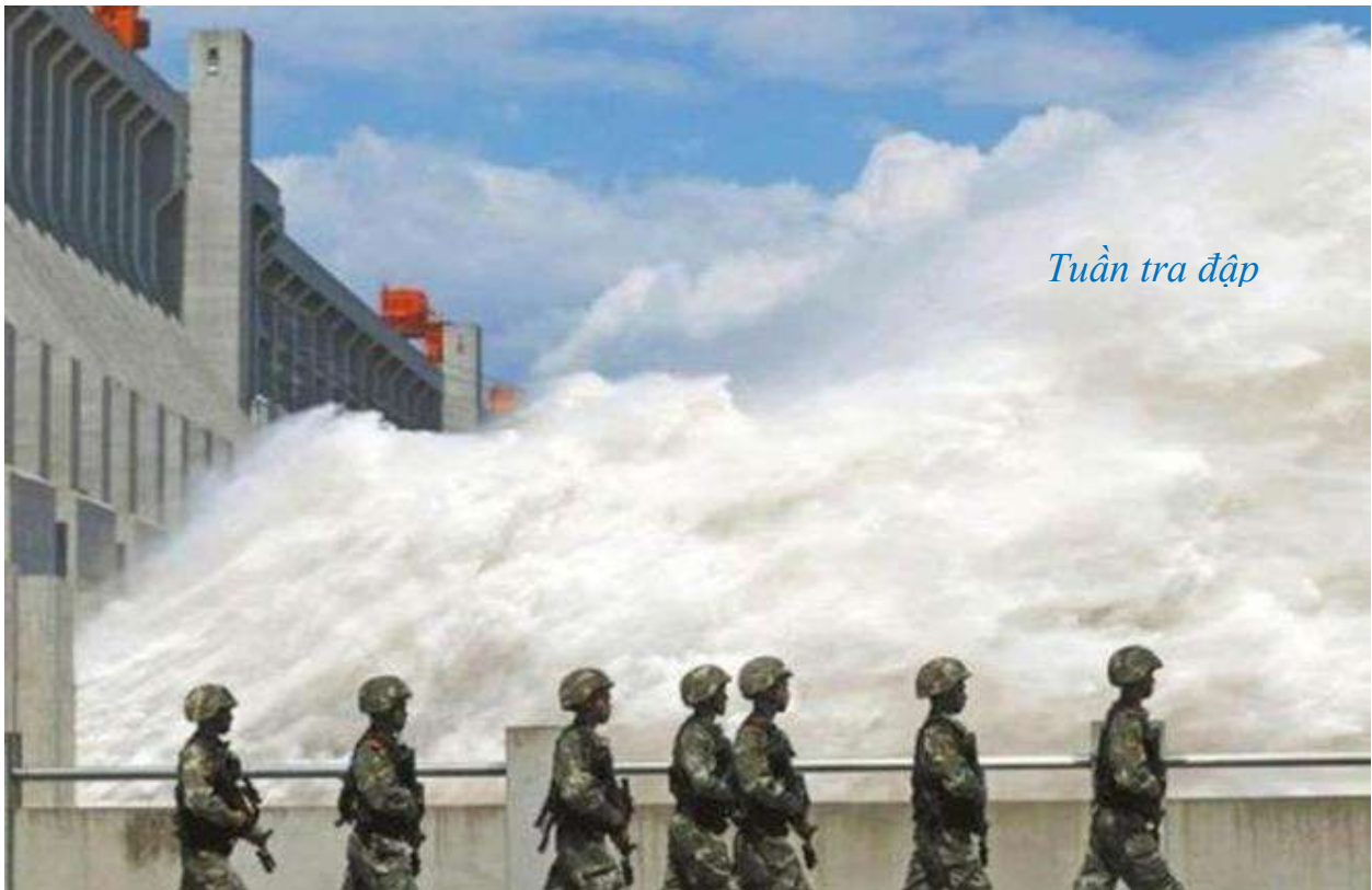
Tuần tra đập