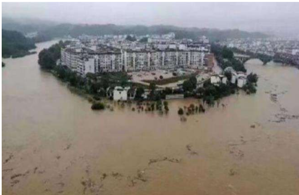
贵州省遵义市遭遇强降雨 多个乡镇被淹