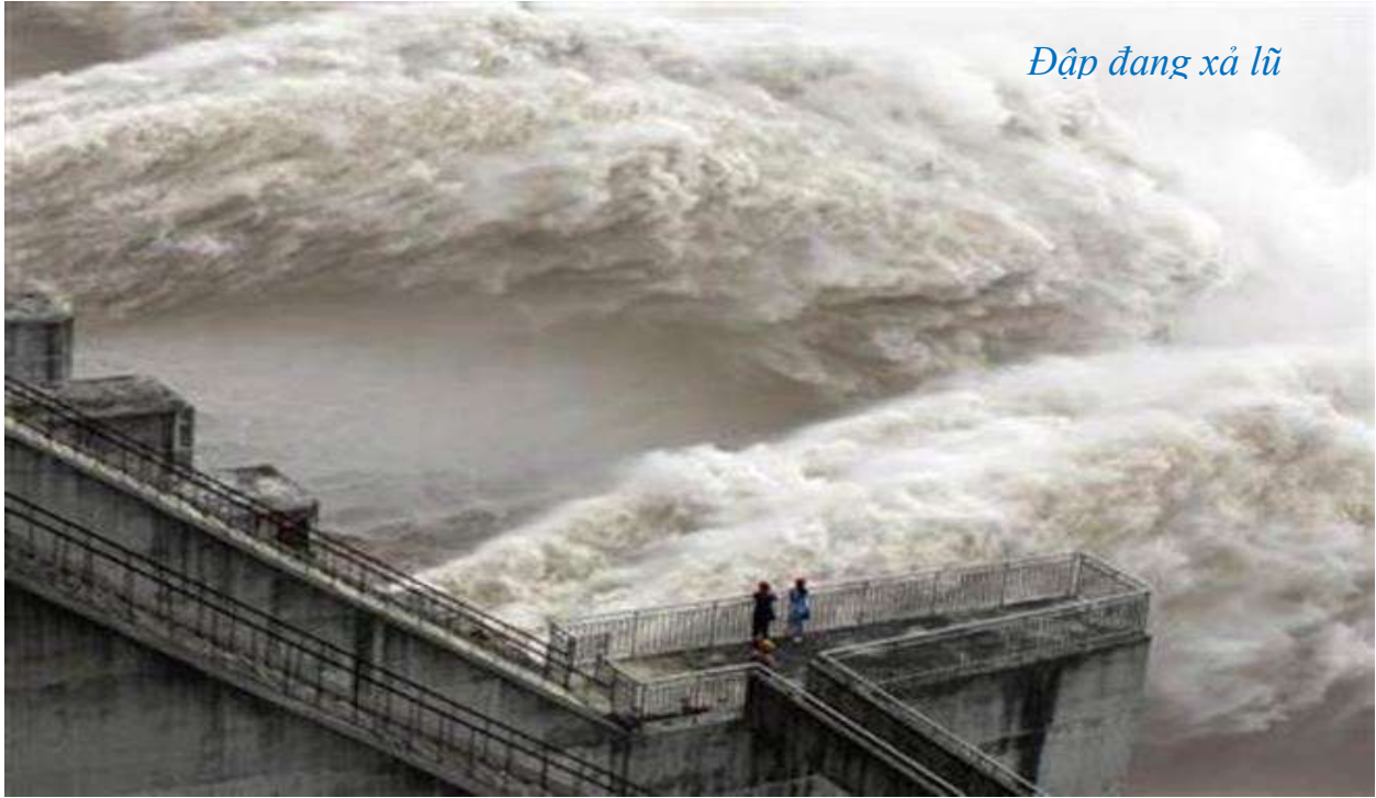
Đập đang xả lũ