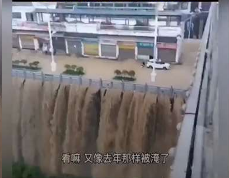
看嘛 又像去年那样被淹了