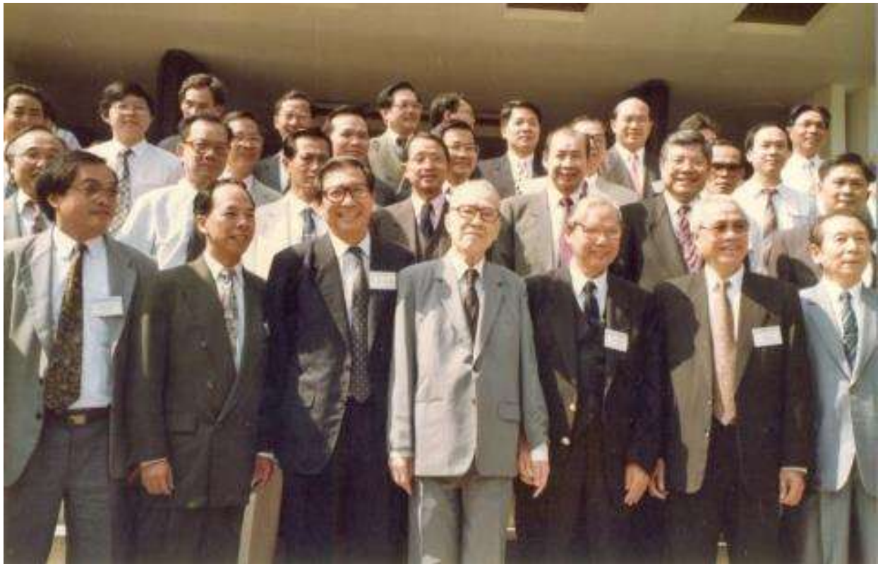
Luật sư Nguyễn Hữu Thọ, Thủ tướng Võ Văn Kiệt chụp ảnh kỷ niệm với đại biểu tham dự Hội nghị Việt kiều Xuân Quý Dậu 1993

Mặc dù tuổi đã cao, Luật sư đã dự suốt Hội nghị Việt kiều Xuân Quý Dậu tổ chức hai ngày 8, 9 tháng 2 năm 1993 tại Dinh Thống Nhất Thành phố Hồ Chí Minh. Sự có mặt của Luật sư và bài nói chuyện của Thủ tướng Võ Văn Kiệt đã động viên rất nhiều hơn 100 đại biểu từ 24 nước về tham dự, và là một sự khẳng định mạnh mẽ rằng “Người Việt Nam ở nước ngoài là bộ phận không tách rời của cộng đồng dân tộc Việt Nam”.