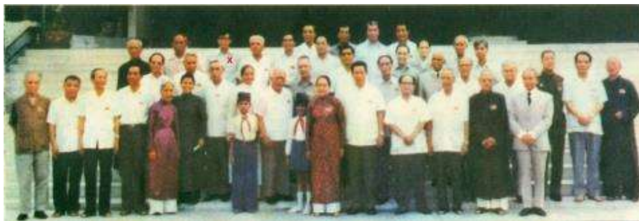
Đoàn Chủ tịch Ủy ban Trung ương Mặt trận Tổ Quốc Việt Nam, khóa I, 07/02/1977

Sự thân ái, chan hòa mà Luật sư dành cho các thành viên trong Đoàn Chủ tịch và Ủy ban Trung ương Mặt trận Tổ Quốc Việt Nam từ mọi miền Tổ quốc tựu họp về, đủ các sắc tộc, tôn giáo, theo tôi cảm nhận, là thể hiện rất tự nhiên của sự quan tâm chân thành của Luật sư đối với các tầng lớp nhân dân và đồng bào cả nước.