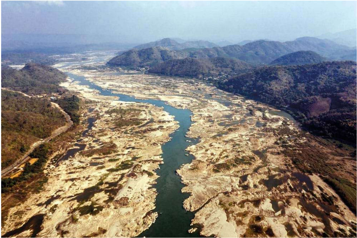
Sông Mekong trơ đáy, với những đụn cát ở đoạn chảy qua Sangkhom (Thái Lan) tháng 1.2020, nguyên nhân được cho là do các đập thủy điện của Trung Quốc giữ lại một lượng nước lớn ở thượng nguồn sông Mekong, gây thiệt hại cho khu vực hạ lưu.

Ở mặt nào đó cuốn sách này tiếp nối cuốn sách của Milton Ostern với nỗi lo về một Trung Quốc đang trỗi dậy sẽ tác động đến các quốc gia cuối dòng Mekong như thế nào. Các tác động môi trường và xã hội của việc bành trướng kinh tế của Trung Quốc vào hạ Mekong cũng là một chủ đề khác được trình bày trong sách. Tuy nhiên, sách này không được viết với thành kiến chống Trung Quốc. Tôi đã sống và làm việc ở Trung Quốc trong 15 năm, và tôi hiểu quan điểm và thế lưỡng nan trong phát triển của Trung Quốc cũng sâu sắc như hiểu quan điểm và thế lưỡng nan của 5 quốc gia hạ Mekong.