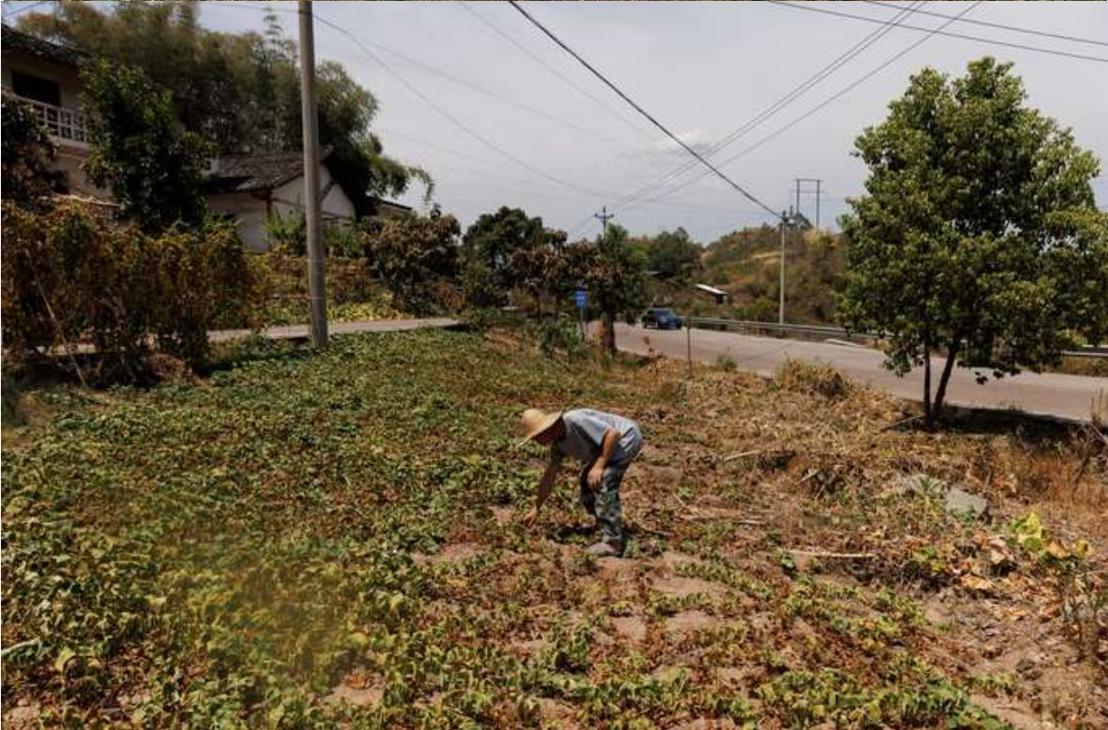
Đất trồng trọt khô cằn trong lưu vực