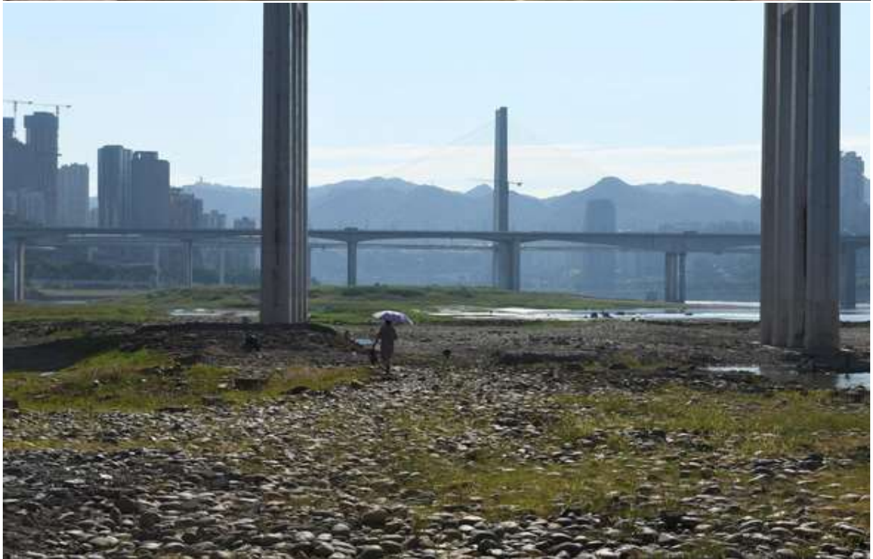
Đoạn sông Dương Tử qua TP Trùng Khánh