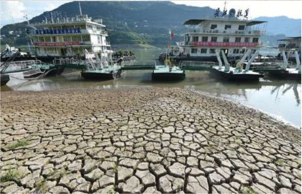
Lưu thông trên sông ngưng trệ