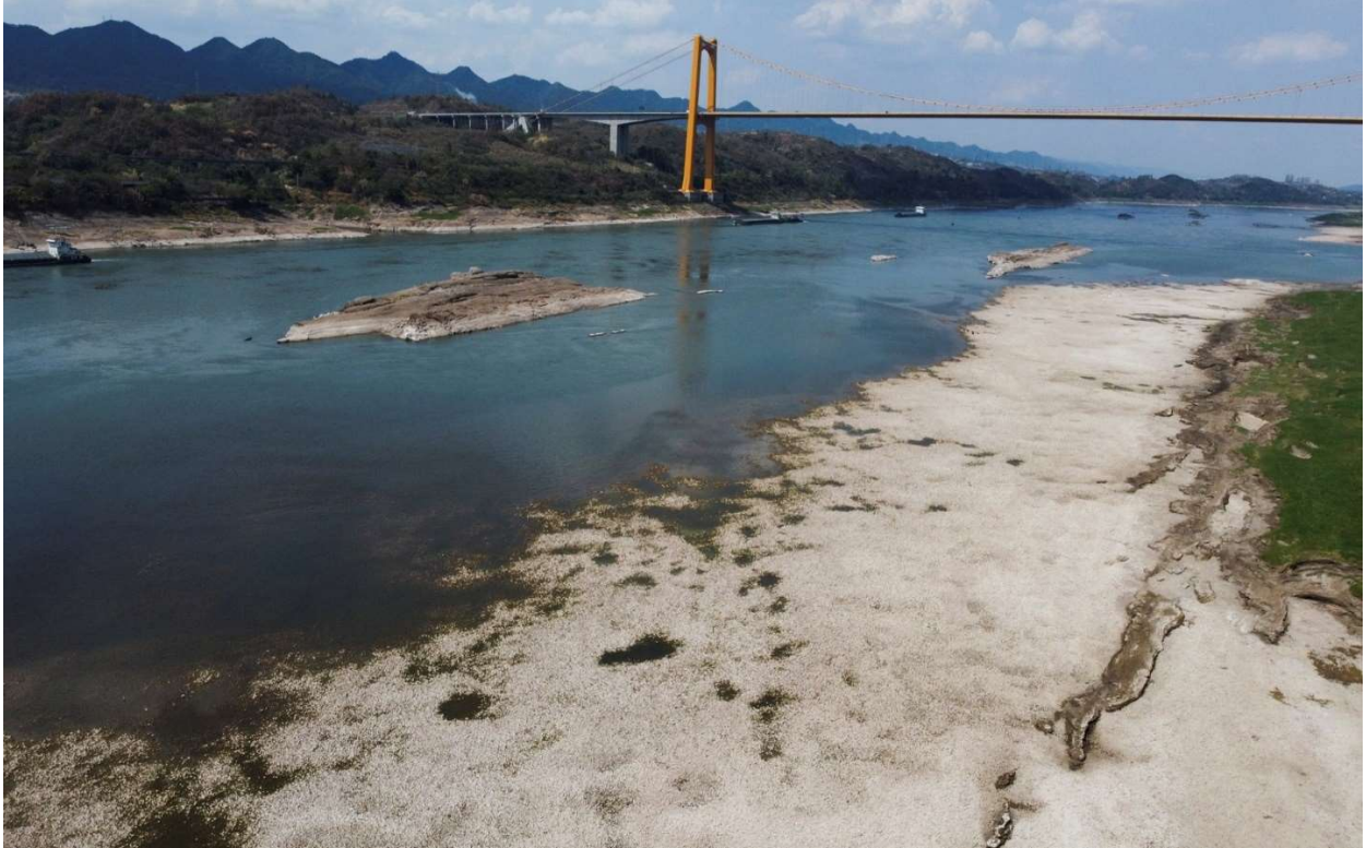
Có thể đi bộ trên bãi và lội qua sông