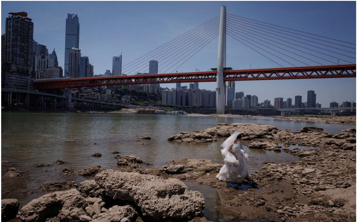
Chụp ảnh cưới ở đáy sông