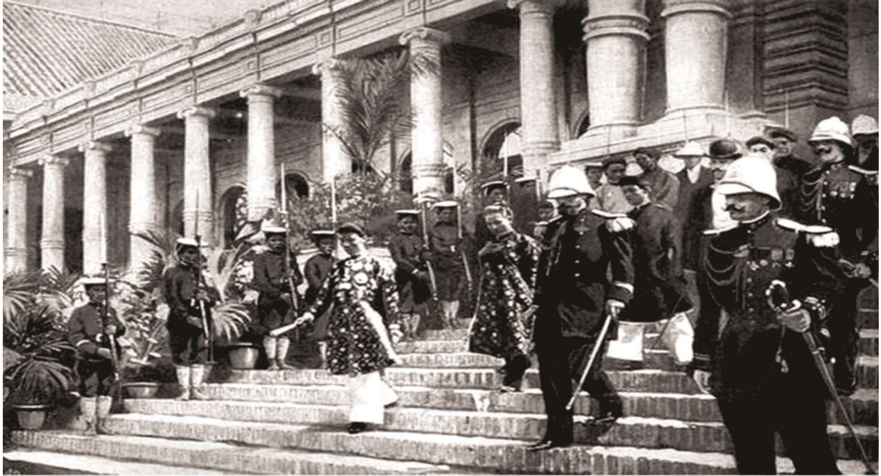
Vua Thành Thái và Hoàng hậu thăm Tòa cung điện xây dựng cho kỳ Hội chợ đầu xỏ sắp tới tại Hà Nội (báo LES NOUVELLES ILLUSTRÉES ngày 17-6-1902)

Vua Thành Thái và hoàng hậu tới dự khai trương triển lãm Đầu xỏ năm 1902.