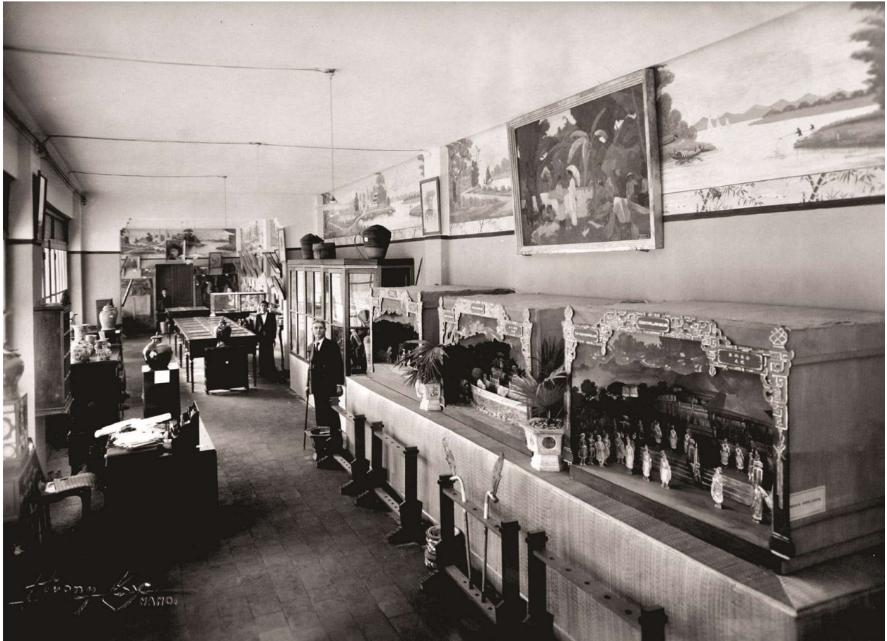
Tác phẩm của thầy trò Trường Mỹ thuật Đông Dương tham gia các kỳ Đấu xảo. Trên tường có bức tranh sơn dầu của họa sĩ Joseph Inguimberty (năm 1938).