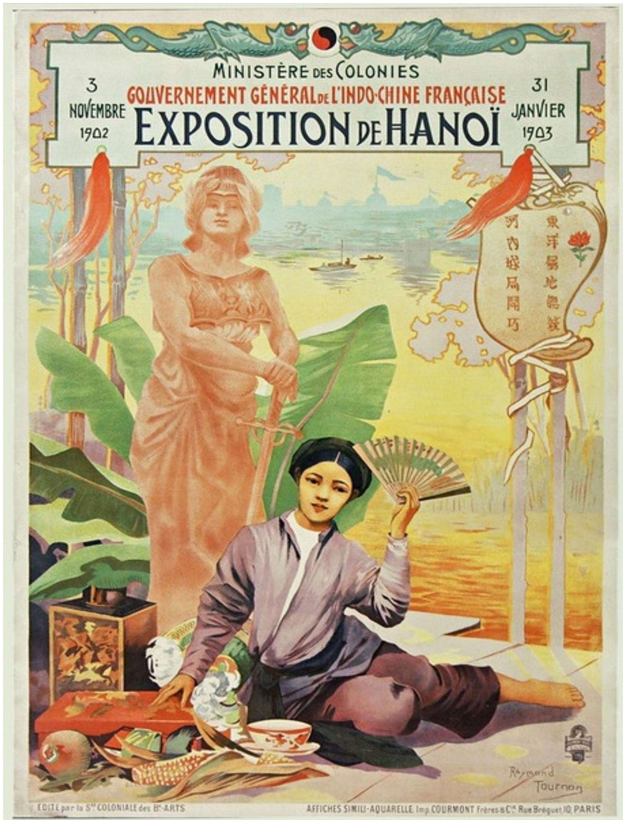
Bích chương Hội chợ - Triển lãm năm 1902.