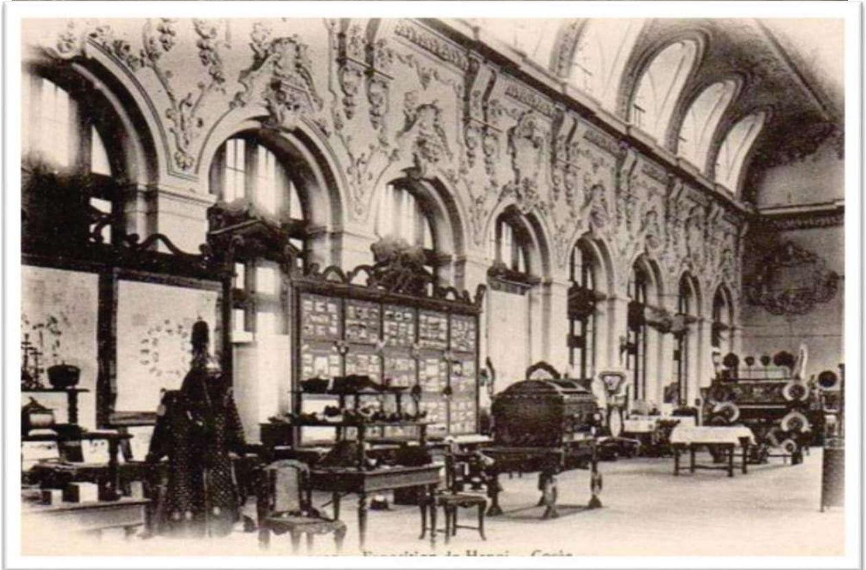
Gian hàng Nhật Bản (ảnh trên) và Hàn Quốc (ảnh dưới) năm 1938. Ảnh: TL