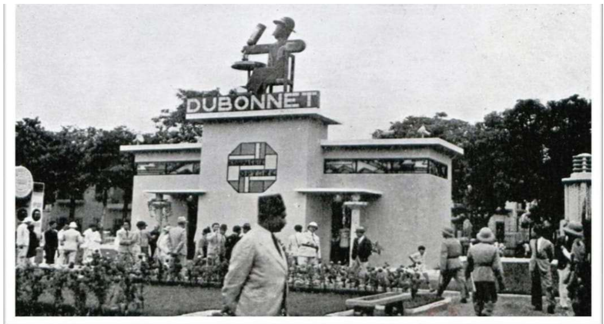
Khu Đấu Xảo thường xuyên có sự tham dự của các hãng nước ngoài (ảnh năm 1938).