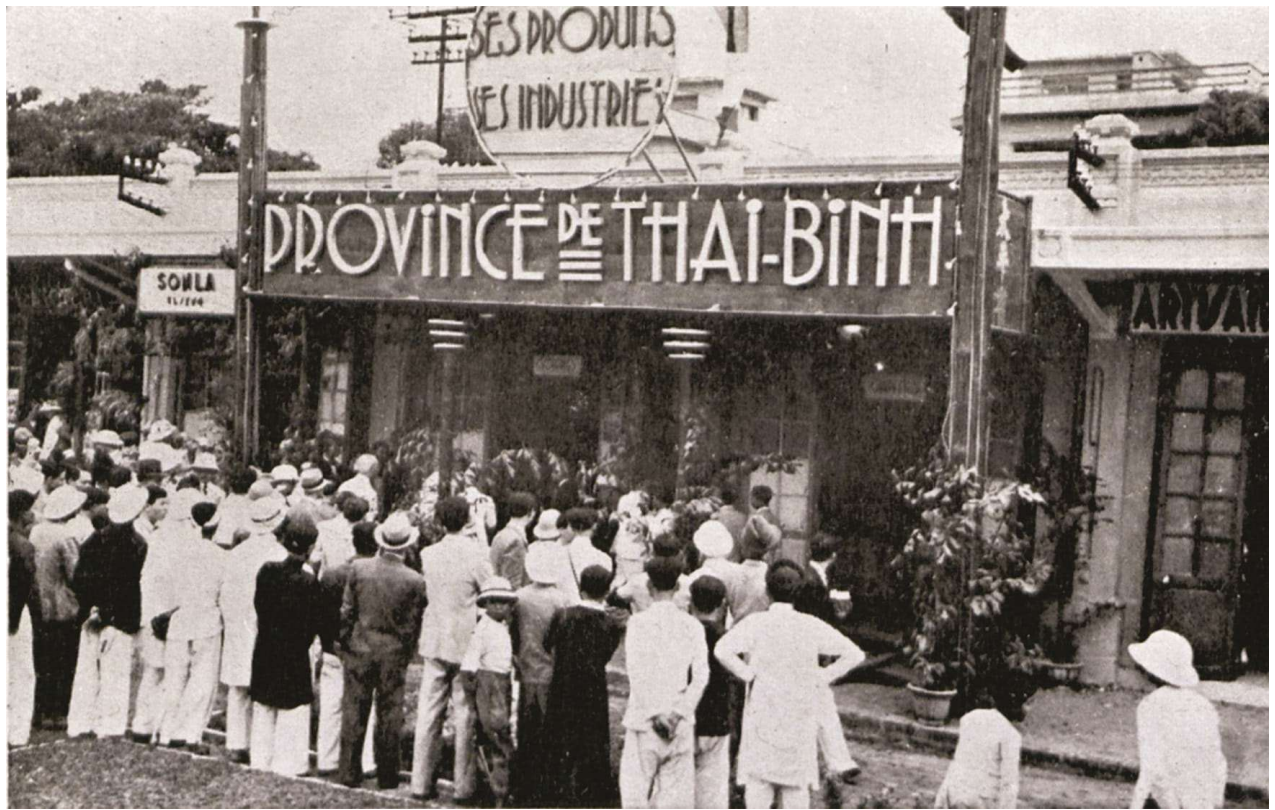
Gian hàng tỉnh Thái Bình năm 1938.