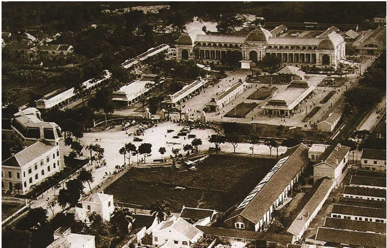
Quang cảnh khu Đấu Xảo nằm trên đại lộ Gambetta (nay là phố Trần Hưng Đạo).

Trong bài viết này, chúng tôi muốn nhấn mạnh đến một không gian văn hóa - kinh tế - thương mại quan trọng bậc nhất ở Hà Nội thời Pháp thuộc. Đó chính là khu vực hội chợ - triển lãm quốc tế mà dân ta vẫn quen gọi là khu Đấu Xảo.