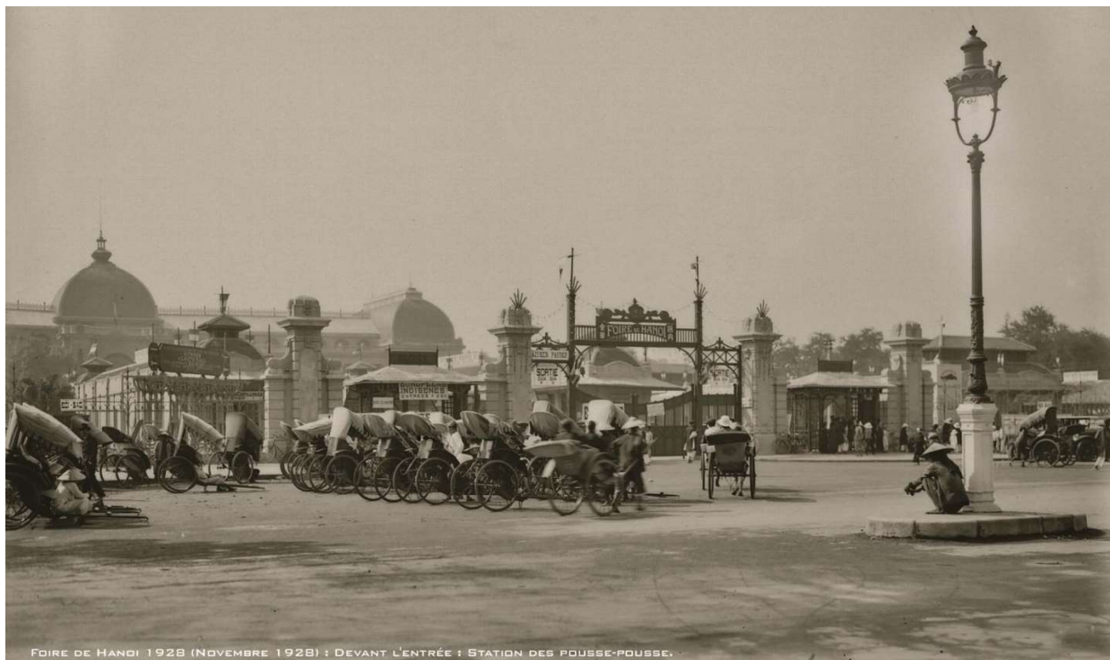
Khu Đấu Xảo năm 1928.

Kể từ năm 1924, khu Đấu Xảo còn có thêm một vệ tinh vô cùng năng động là Trường Mỹ thuật Đông Dương. Hệ sinh thái sáng tạo đã thực sự hoàn thiện, tạo nên sự phát triển vượt bậc cho mỹ thuật và thủ công mỹ nghệ của cả xứ Đông Dương, đặc biệt là Hà Nội. Các lớp học giảng dạy mỹ thuật cho các nghệ nhân do các giáo sư của Trường Mỹ thuật Đông Dương đảm trách.