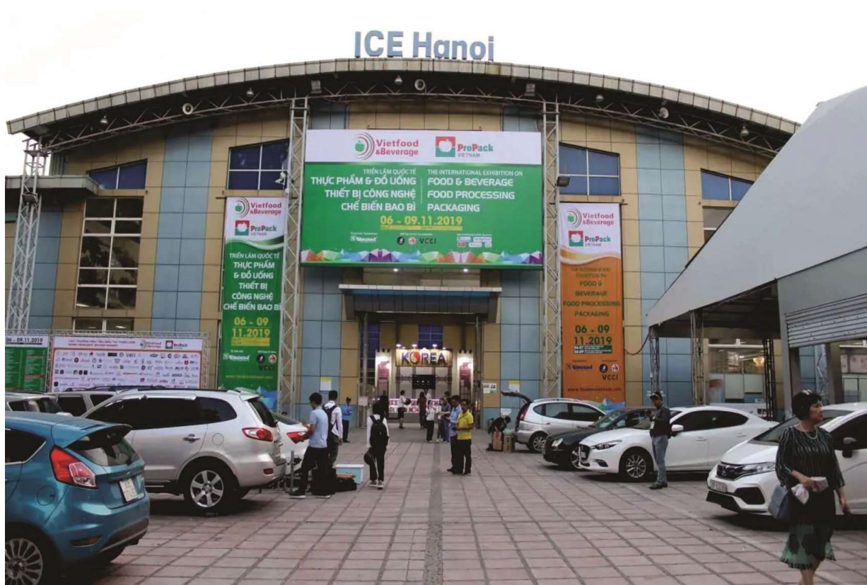
Trung tâm Triển lãm Quốc tế I.C.E Hà Nội (Tên tiếng Anh: Hanoi International Exhibition Center) chiếm một vị trí khiêm tốn và diện tích thu hẹp rất nhiều so với quy mô thời Pháp thuộc.

Đây mới chỉ là con số thống kê của tranh tượng mỹ thuật, qua ảnh tư liệu chúng ta còn thấy sự phong phú các mặt hàng thủ công mỹ nghệ - một lĩnh vực đóng góp quan trọng vào kim ngạch xuất khẩu của Việt Nam hôm nay.