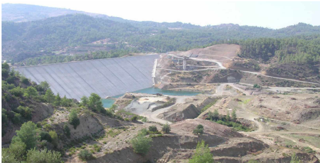
Toàn cảnh đập Kannaviou

Nhân đây xin giới thiệu đôi nét về Cyprus. Trên đảo có 2 cộng đồng dân cư, 80% là người gốc Hy Lạp, 18% gốc Thổ Nhĩ Kỳ. Kinh tế rất phát triển. Thu nhập bình quân đầu người 29105 US$, xếp thứ 25 và chỉ số HDI là 0,903 xếp thứ 29 trên thế giới. Cảnh đẹp thơ mộng của đảo hàng năm thu hút khoảng 2,4 triệu lượt khách du lịch (hơn gấp 3 lần số dân trên đảo). Cyprus có lịch sử lâu đời từ 10000 năm trước công nguyên và ở trên đường giao thương giữa châu Âu và vùng Trung Cận Đông. Kết cục câu chuyện tình đau thương của dũng tướng da đen Othello trong vở bi kịch nổi tiếng của đại văn hào Anh W. Shakespear đã diễn ra trên đảo Cyprus này vào thế kỷ XV.