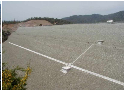
Mái hạ lưu