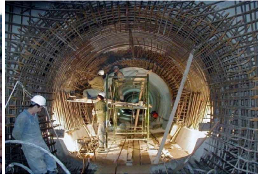
Thi công tunen