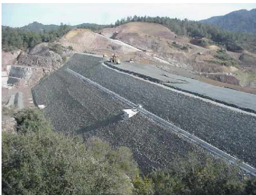
Thi công thân đập