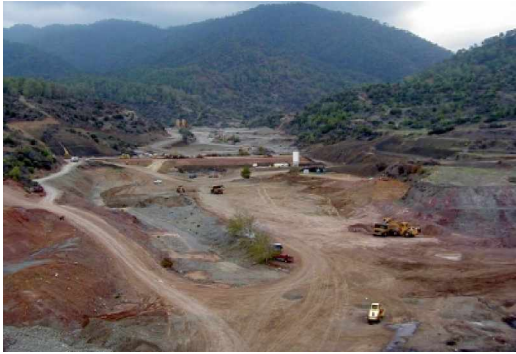
Công trường xây dựng đập

Dưới đây là một số hình ảnh xây dựng đập.