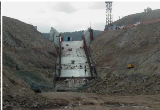
Thi công phần đế bản mặt (trái) và tràn (phải)