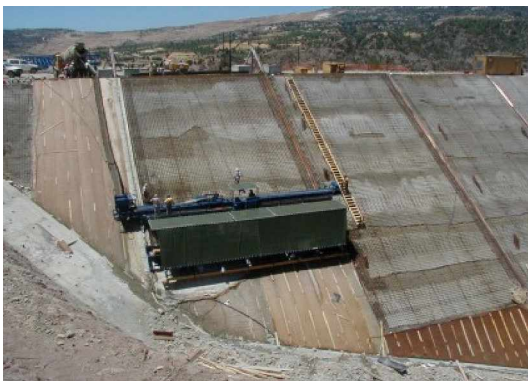
Thi công bản mặt thượng lưu bê tông cốt thép