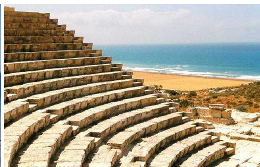
Thăng cảnh ở Cyprus