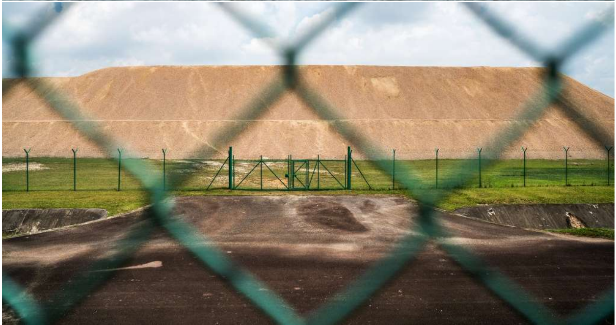
Những kho cát