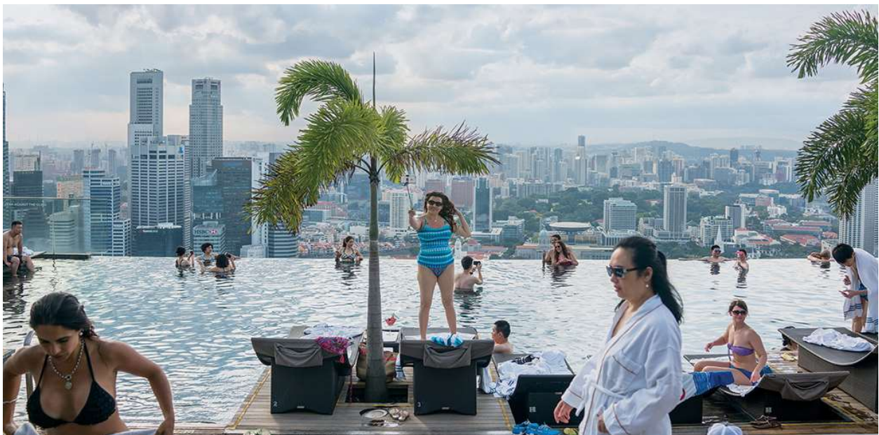
Hồ bơi ở tầng 57 của khách sạn Marina Bay Sands được xây dựng trên một phần đất mở rộng.