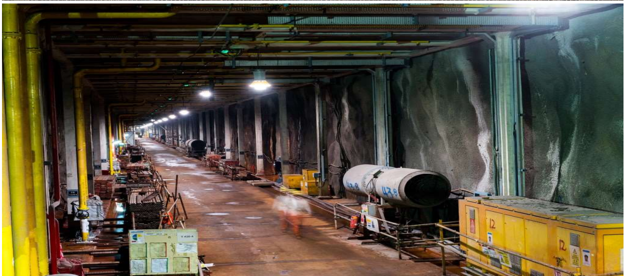
Hiện trường thi công các công trình lấn biển