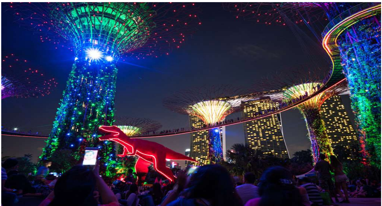
'Gardens by the Bay' là công trình nằm trên phần đất hơn 1 km 2 có được nhờ lấp biển.