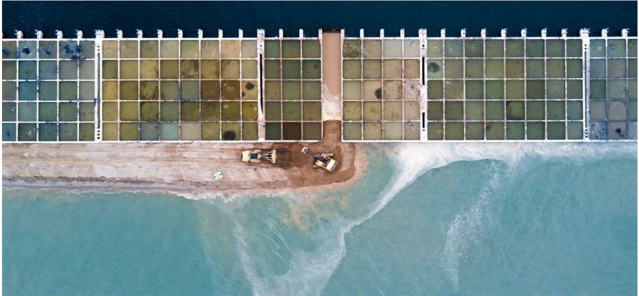
Dự án cải tạo đất để xây dựng siêu cảng Tuas nằm trên mặt nước, nhìn từ trên cao

Với quốc gia có diện tích đứng thứ 192 thế giới, bằng 1/5 thành phố New York (Mỹ), thiếu đất là một nỗi lo luôn theo đuổi người Singapore. Từ khi trở thành một quốc gia độc lập cách đây 52 năm, Singapore đã tăng được diện tích đất của họ thêm 1/4, từ 580 km 2 lên 717 km 2 . Đến năm 2030, chính phủ Singapore tham vọng sẽ mở rộng diện tích đất của họ lên 776 km 2 .