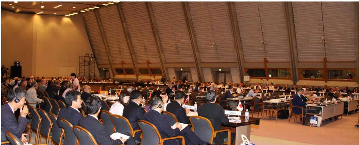
Phiên họp Đại Hội Đồng