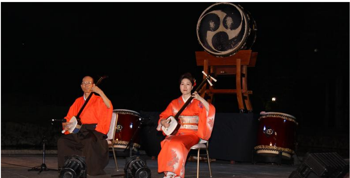
... và biểu diễn nghệ thuật dân tộc chào mừng Đại hội