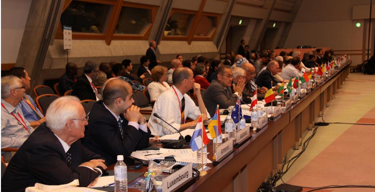
Đại diện các Hội thành viên tại phiên họp Đại Hội Đồng