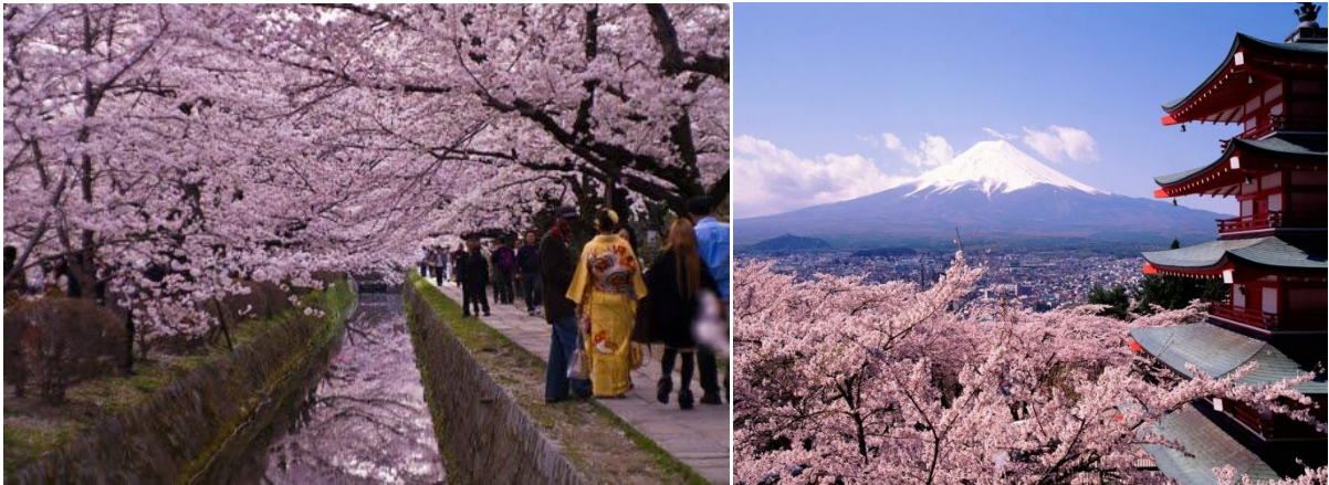
Cố đô Kyoto cổ kính, yên bình và mến khách