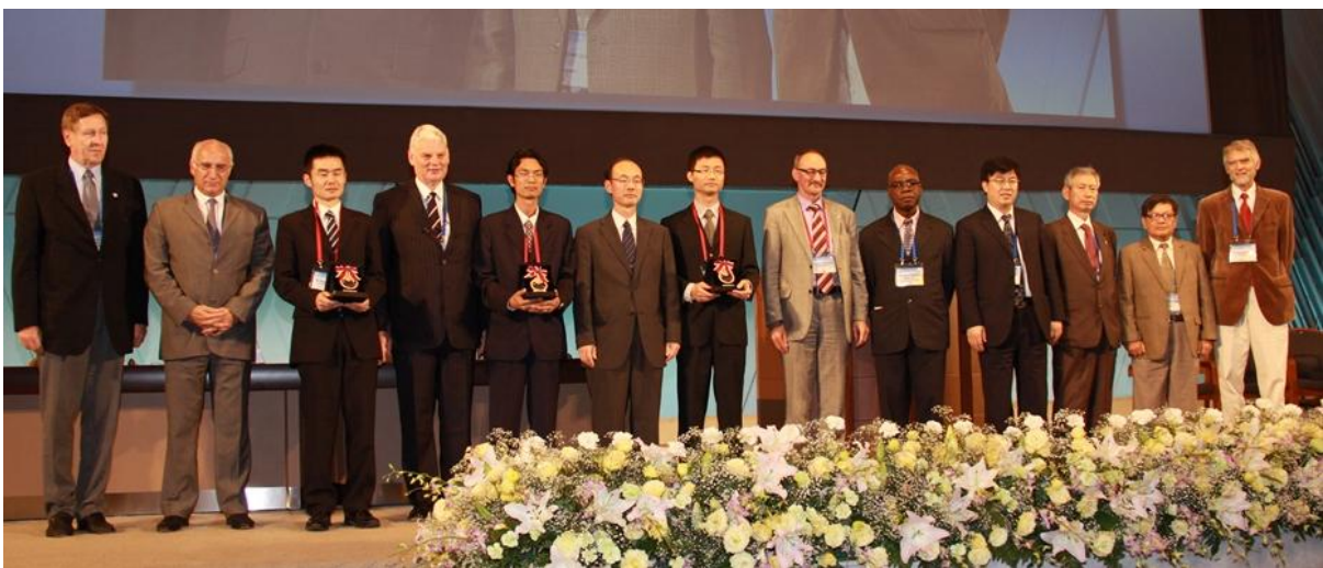
Lãnh đạo ICOLD và các chuyên gia trẻ được vinh danh