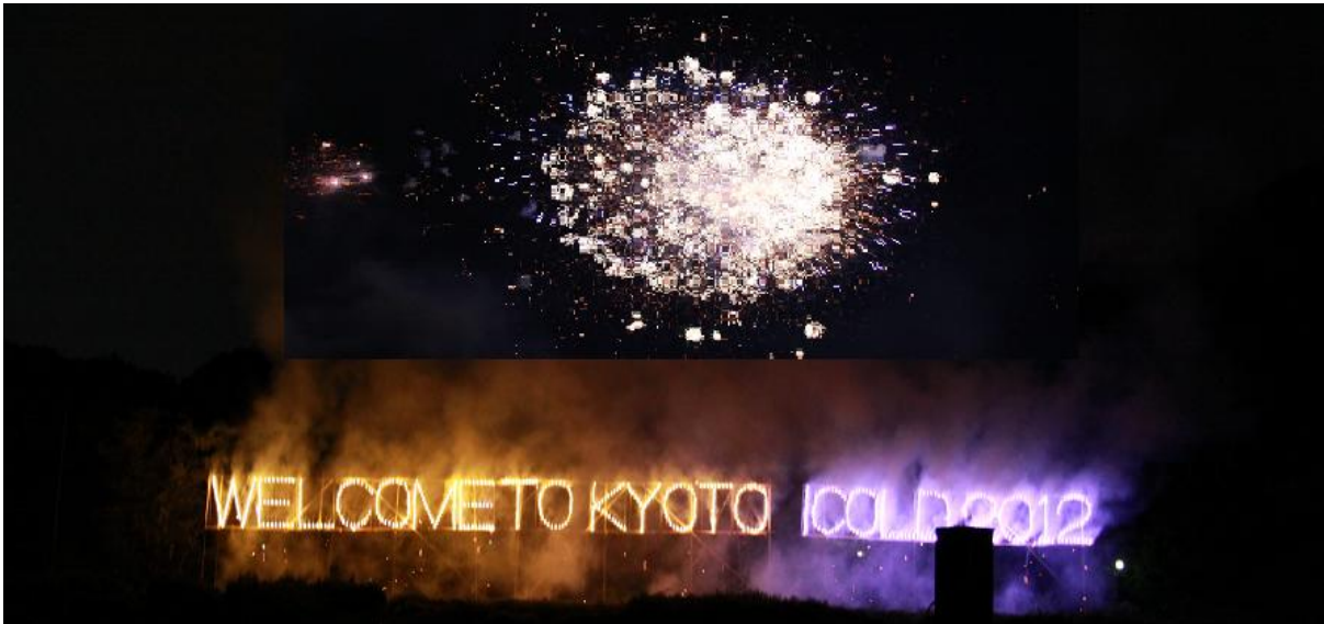
Pháo hoa rực rỡ...