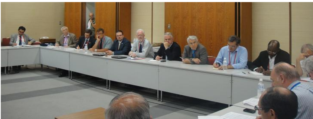
Họp nhóm các nước sử dụng tiếng Pháp