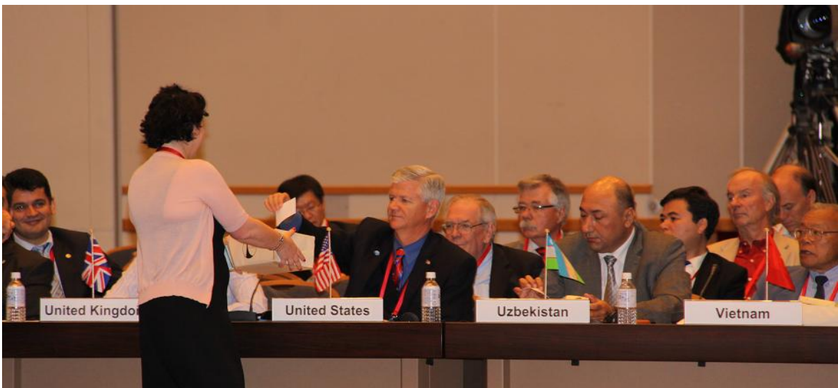
Tiến hành bỏ phiếu kín cho các quyết định quan trọng