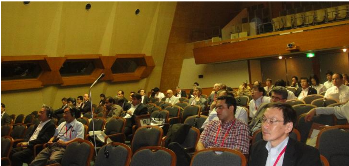
Hội nghị khoa học: Phiên toàn thể (trên) và phiên họp tại các tiểu ban