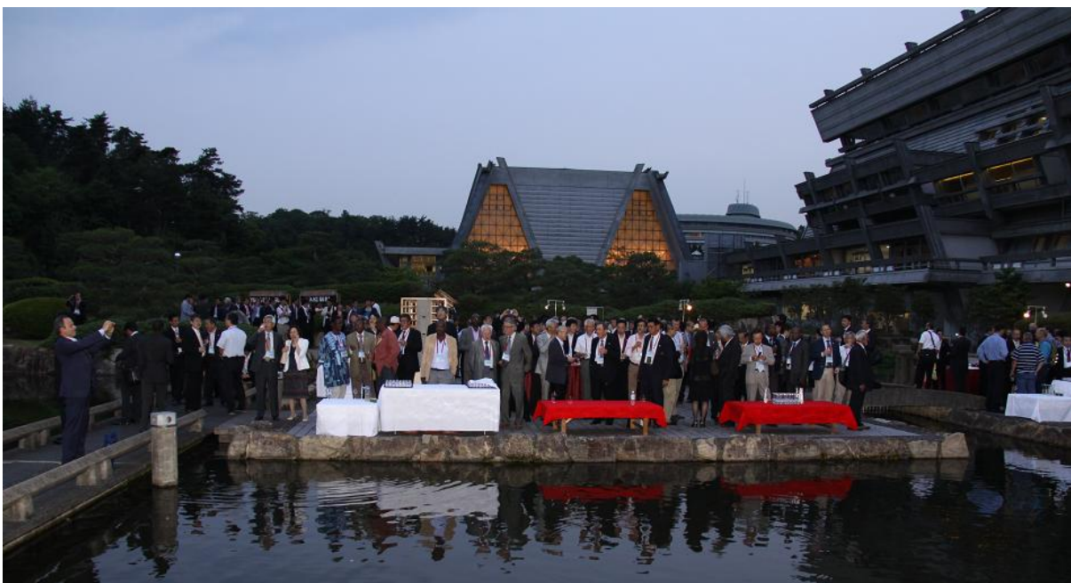
Trong khuôn viên Trung tâm Hội nghị Quốc tế