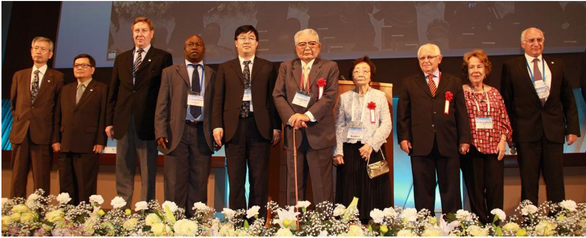
Lãnh đạo ICOLD và các vị chuyên gia lão thành được vinh danh cùng các phu nhân