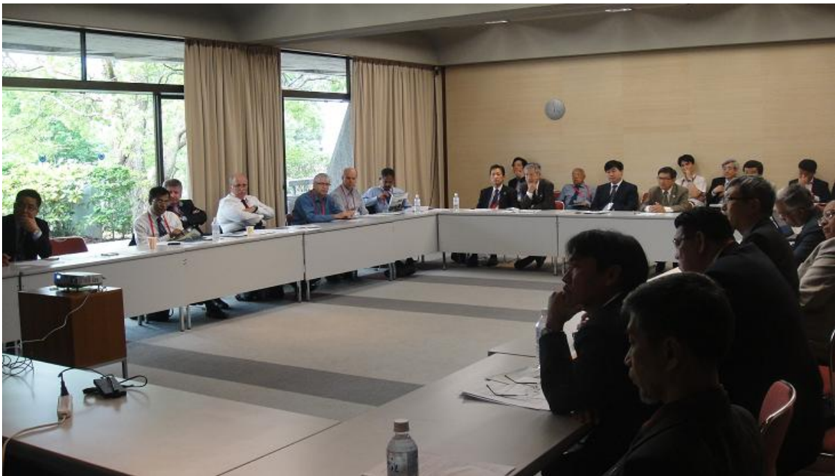
Họp nhóm các Hội vùng châu Á – Thái Bình Dương (APG)