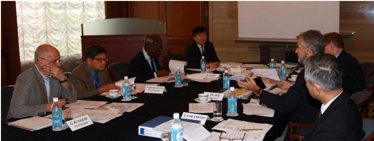
Họp Ban Lãnh đạo ICOLD