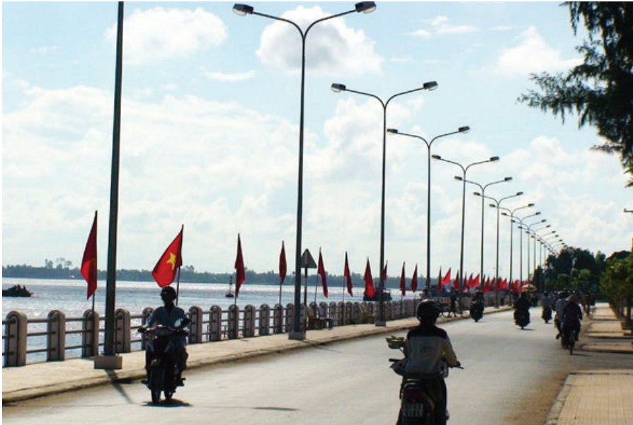
Kè Tân Châu - một trong những kết quả chỉnh trị sông ở ĐBSCL.

sông” (bao gồm diễn biến bờ sông và diễn biến lòng dẫn), thủy động lực học lòng sông (hay thủy động lực học sông ngòi). Đây là một phương pháp chuyên dùng các hệ phương trình vi phân đạo hàm riêng phi tuyến để nghiên cứu mô phỏng diễn biến lòng sông, ngoài ra còn có các phương pháp khác như phân tích toán thống kê, thực nghiệm... Mặc dù vậy, ngành khoa học đầy gian nan này trên phạm vi thế giới nói chung và ở Việt Nam (trong đó có ĐBSCL) nói riêng đã đạt được nhiều thành tựu quan trọng: Đó là đã làm rõ được cấu trúc và cơ chế thủy động lực của dòng chảy với vỏ lòng sông, xác định được hệ thống các nguyên nhân gây ra đào xói, bồi lắng lòng dẫn và sạt lở đất bờ sông, các tương tác giữa thượng nguồn với châu thổ, biển, quá trình sông - biển, các mối quan hệ nhân quả tự nhiên giữa khí hậu, địa hình, thổ nhưỡng, địa chất, lớp phủ, thủy triều... Dự báo và cảnh báo quá trình diễn biến lòng sông, đề xuất các giải pháp công trình và phi công trình chỉnh trị lòng sông và bảo vệ bờ sông, trong đó nhấn mạnh rằng khi đoạn sông chảy qua các khu vực kinh tế quan trọng