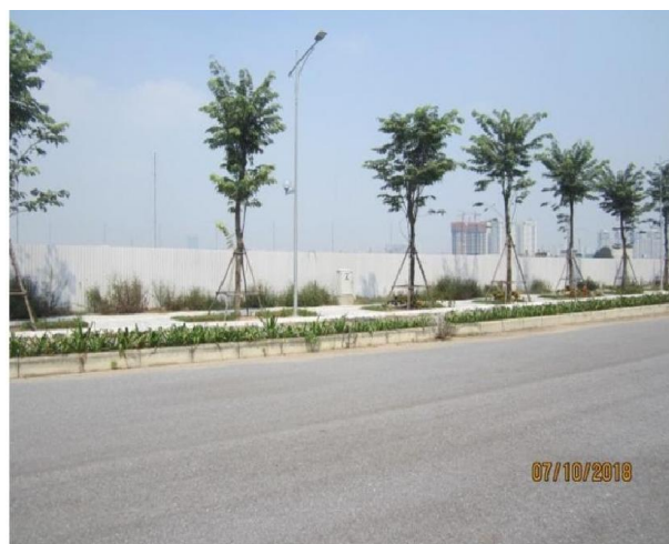
MẶT TIỀN và đoạn đường mới Nguyễn Xiển – Xa La không xe cộ, vì vẫn bị chặn ở hai giao cắt với đường Vành đai 3 và Phan Trọng Tuệ.