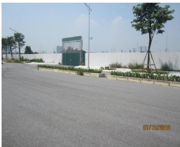
CỐNG CHÍNH, MẶT TIỀN nhà máy XLNT Yên Xá. Chỉ có thể chụp ảnh được vào bên trong khu đất thông qua ô rất bé để thò tay mở và đóng khóa tại cổng.

Ngày 20/2/2017 tôi đã gửi thư kèm bài viết chi tiết tới Bộ Xây dựng, UBND thành phố Hà Nội, các Bộ ngành liên quan, tuy nhiên cho đến nay không một hồi âm. Ngày 07/10/2018 tôi đã đi tìm hiểu nơi xây dựng nhà máy XLNT Yên Xá xem động tĩnh ra sao. Chính xác đang là một vùng đất trống mênh mông bỏ hoang vắng, chưa đào 1m cống nào, không một máy đào kích cống ngầm hiện đại được sử dụng như đã đề xuất, như những ảnh dưới đây: