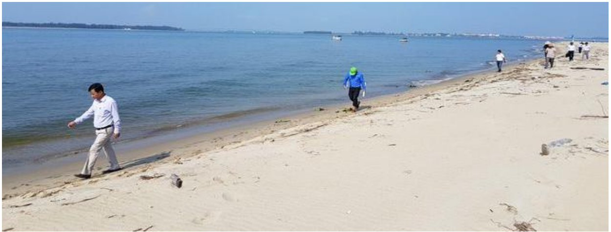
Một bãi biển đẹp, nước trong xanh