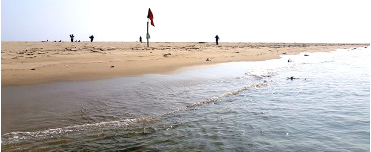
Chỗ nổi cao khoảng 2m