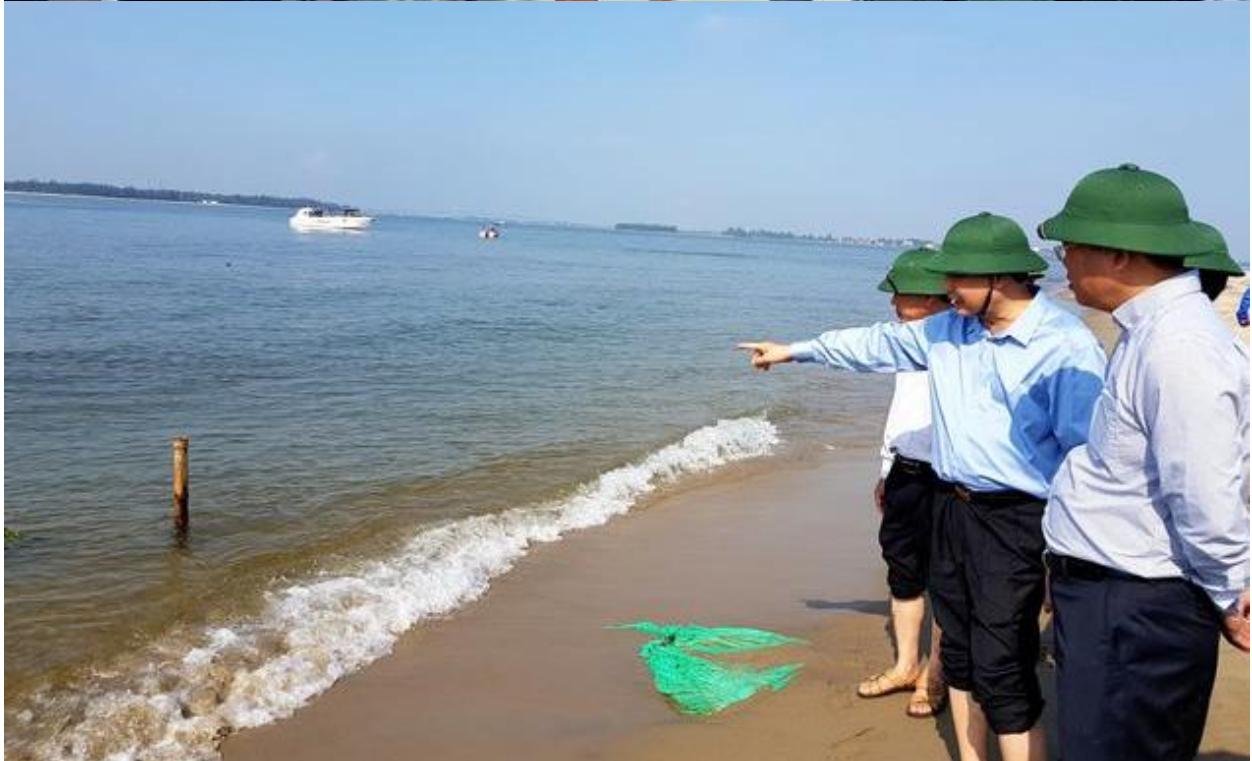
Đoàn thị sát thực địa của Tổng cục Phòng chống thiên tai & tỉnh Quảng Nam tại đảo nổi