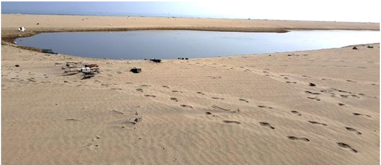
Một hồ nước giữa đảo nổi