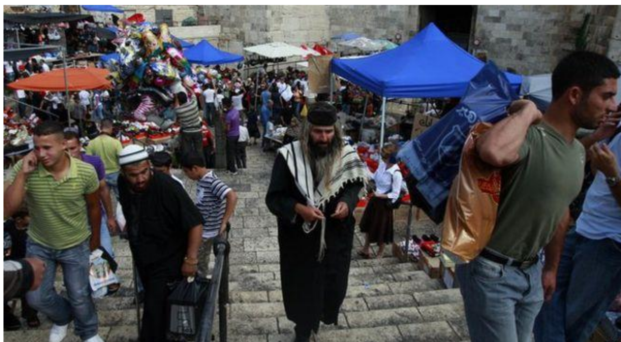
A narrow alleyway in the Old City. Một ngõ hẻm trong Khu Phố Cổ

Jerusalem - tên của nó vang dội trong trái tim của những người theo đạo Thiên chúa, người Do Thái và người Hồi giáo như nhau và vang vọng qua nhiều thế kỷ của lịch sử tranh chấp và chia sẻ. Được gọi trong tiếng Do Thái là Yerushalayim và trong tiếng Arab là al-Quds, nó là một trong những thành phố lâu đời nhất trên thế giới. Nó đã bị chinh phục, phá hủy và xây dựng lại qua nhiều lần, và mỗi tầng đất của nó đều lộ ra một mảnh khác của quá khứ. Mặc dù nó vẫn luôn là tâm điểm của những câu chuyện về chia cắt và xung đột giữa những người theo các tôn giáo khác nhau, nó vẫn là nơi tụ hội họ trong niềm sùng kính vùng đất thánh. Vùng lõi của Khu Phố Cổ là một mê cung với những ngõ ngách hẻm và kiến trúc lịch sử đặc trưng cho bốn tiểu khu - Thiên chúa giáo, Hồi giáo, Do Thái và Armenia. Nó được bao quanh bởi một bức tường đá giống như pháo đài và là nơi có một số địa điểm thiêng liêng nhất trên thế giới.