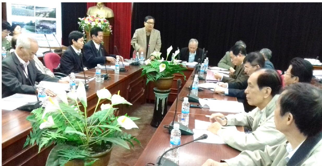
Khai mạc Hội thảo