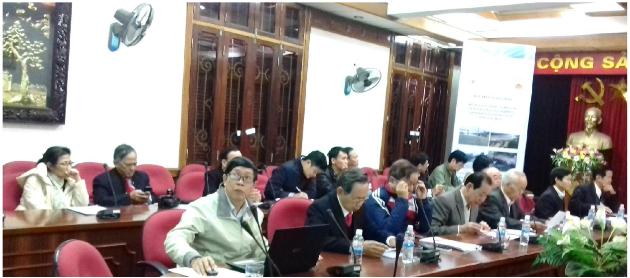
Các đại biểu tại hội thảo