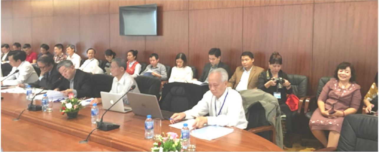
Các đại biểu chăm chú nghe các báo cáo