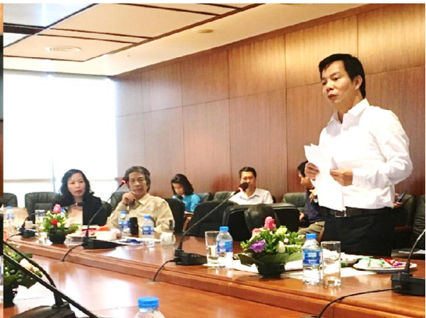
Lãnh đạo các Sở: Quy hoạch & Kiến trúc, Xây dựng TP Hà Nội tham gia thảo luận