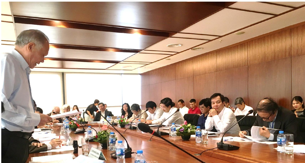
Chủ tịch Tổng hội Xây dựng Việt Nam trình bày đề dẫn