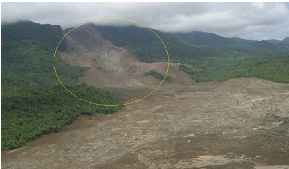
Vùng mặt trượt rộng 25 hecta