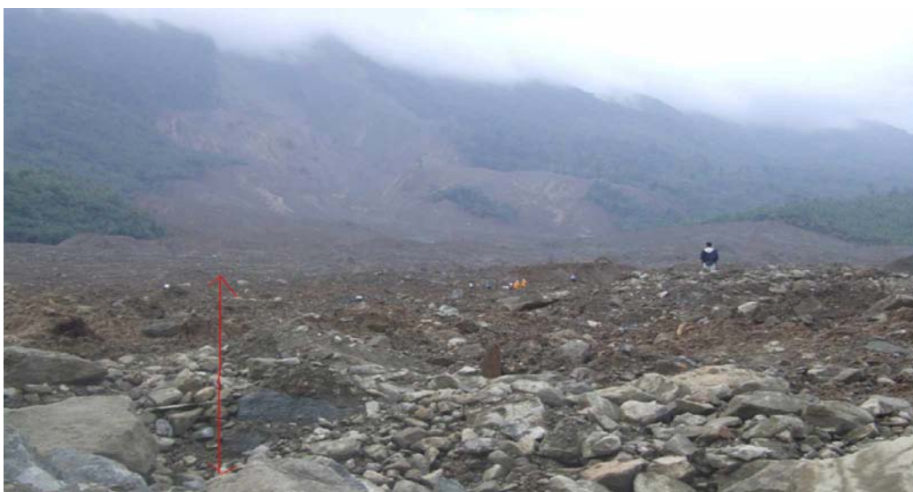
Hố ở chân mái trượt sâu 5m