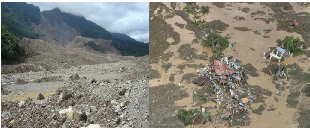
Vùng bị ảnh hưởng và tàn phá rộng 240 hecta