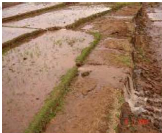
Sử dụng nước lãng phí mặc dù đã được hướng dẫn