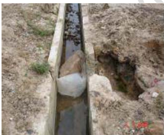
Kênh đã được kiên cố

Nhà nước đã có chủ trương, cơ chế và chính sách về PIM, thậm chí có sự phân công rành mạch, nhằm gắn trách nhiệm của của các bên liên quan ( thuộc nhà nước ) để phát triển PIM theo một “lộ trình” đã được thống nhất, nhưng do các bên chưa nhận rõ vai trò và trách nhiệm của mình trong việc thực hiện chức năng quản lý nhà nước đối với PIM nên “ lộ trình” vẫn không thực hiện được