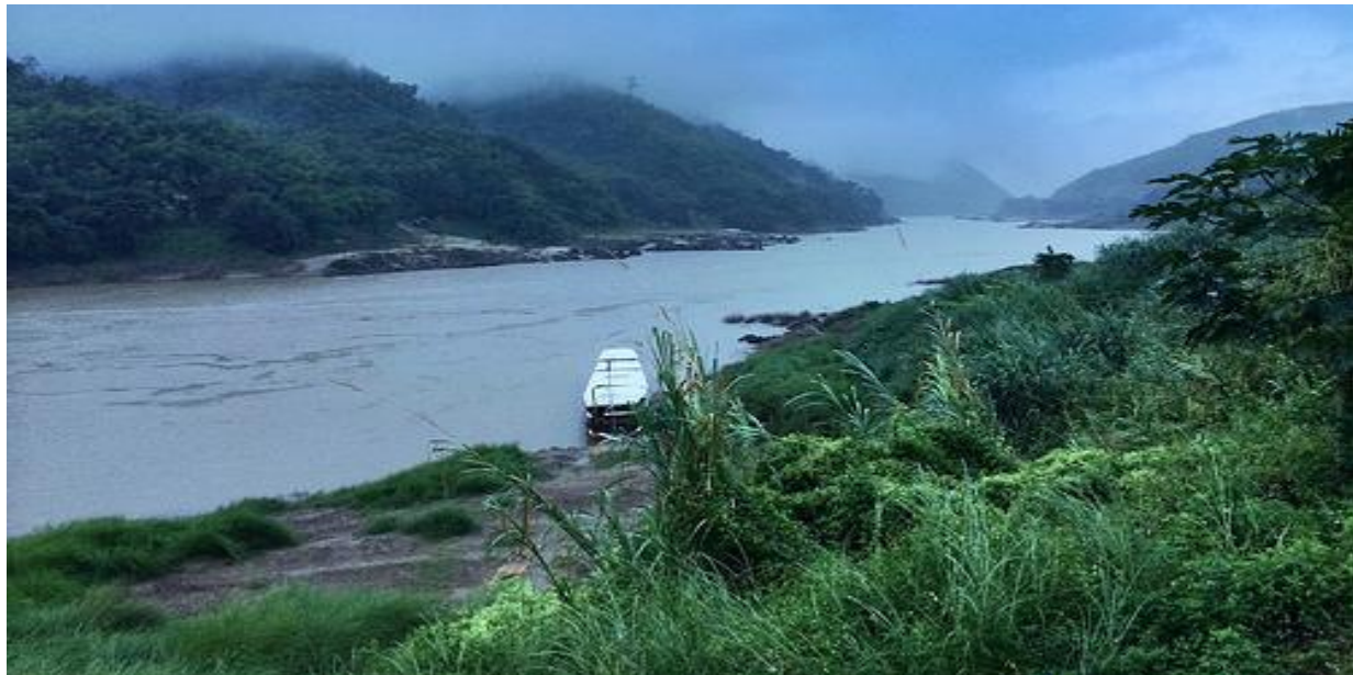
Nơi sẽ xây dựng đập Pak Beng giữa dòng chính Mekong