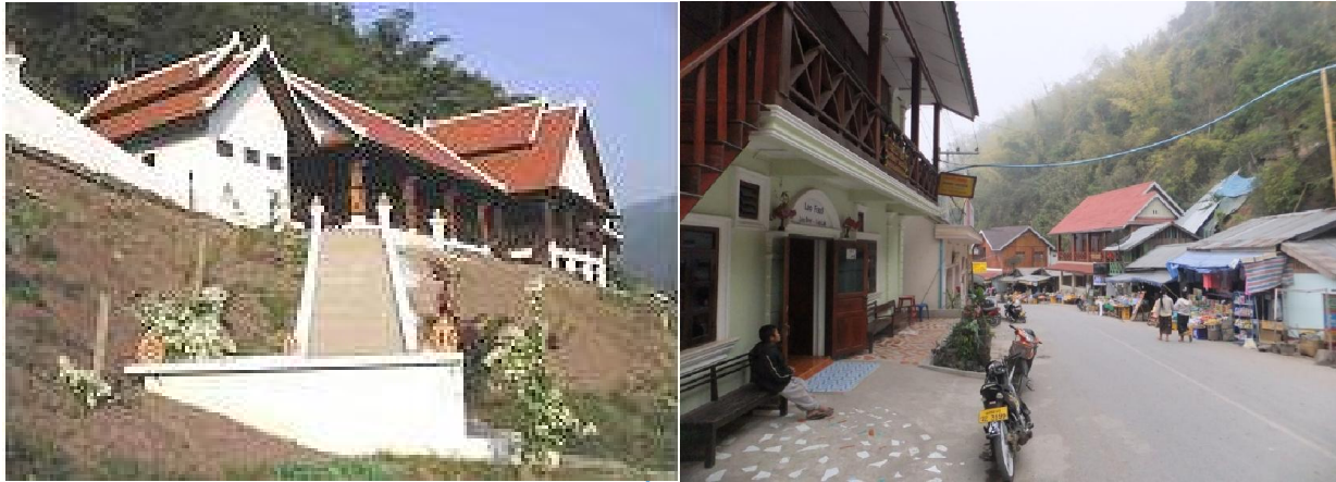
Thị trấn Pak Beng

Biên bản ghi nhớ được ký ngày 29/8/2007 giữa Chính phủ Lào & Tập đoàn Đầu tư Hải ngoại Đại Đường (Datang) của Trung Quốc. Công việc chuẩn bị được xúc tiến gấp gáp. Chủ đầu tư dự án đập thủy điện Đập Don Sahong đang xây dựng ở tỉnh Champasak (Nam Lào) tuy mang danh Ngân hàng First Bank của Malaysia nhưng thực chất là Tập đoàn Sinohydro của Trung Quốc.