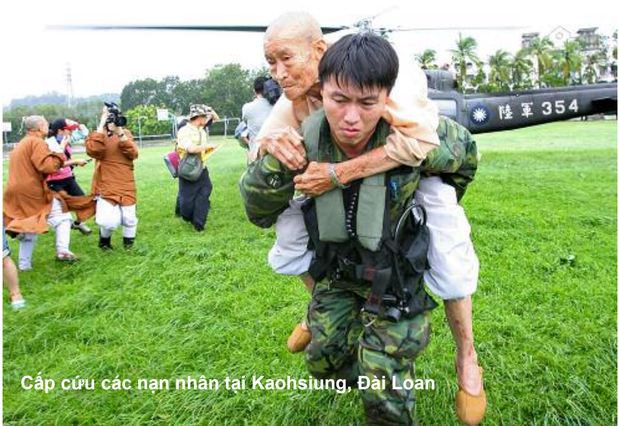
Cấp cứu các nạn nhân tại Kaohsiung, Đài Loan