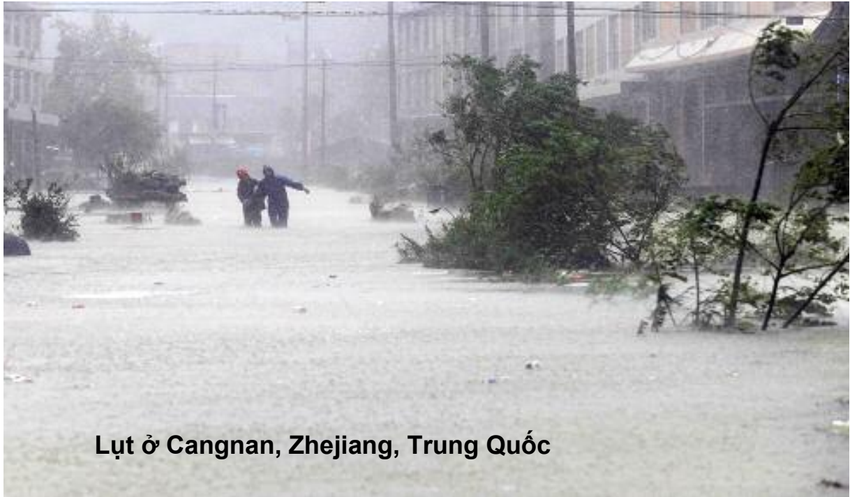
Lụt ở Cangnan, Zhejiang, Trung Quốc