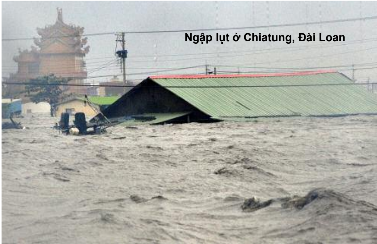
Ngập lụt ở Chiutung, Đài Loan