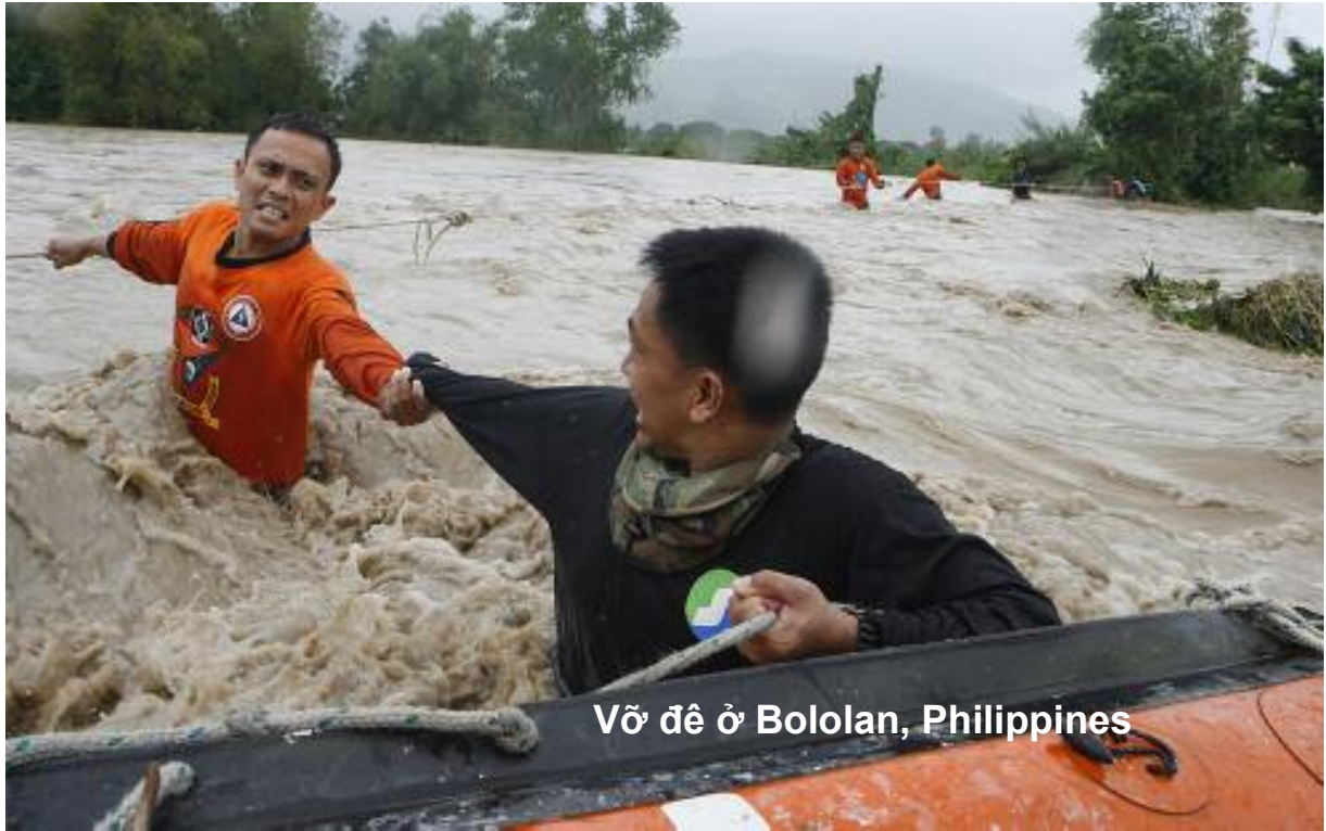
Vỡ đê ở Bololan, Philippines