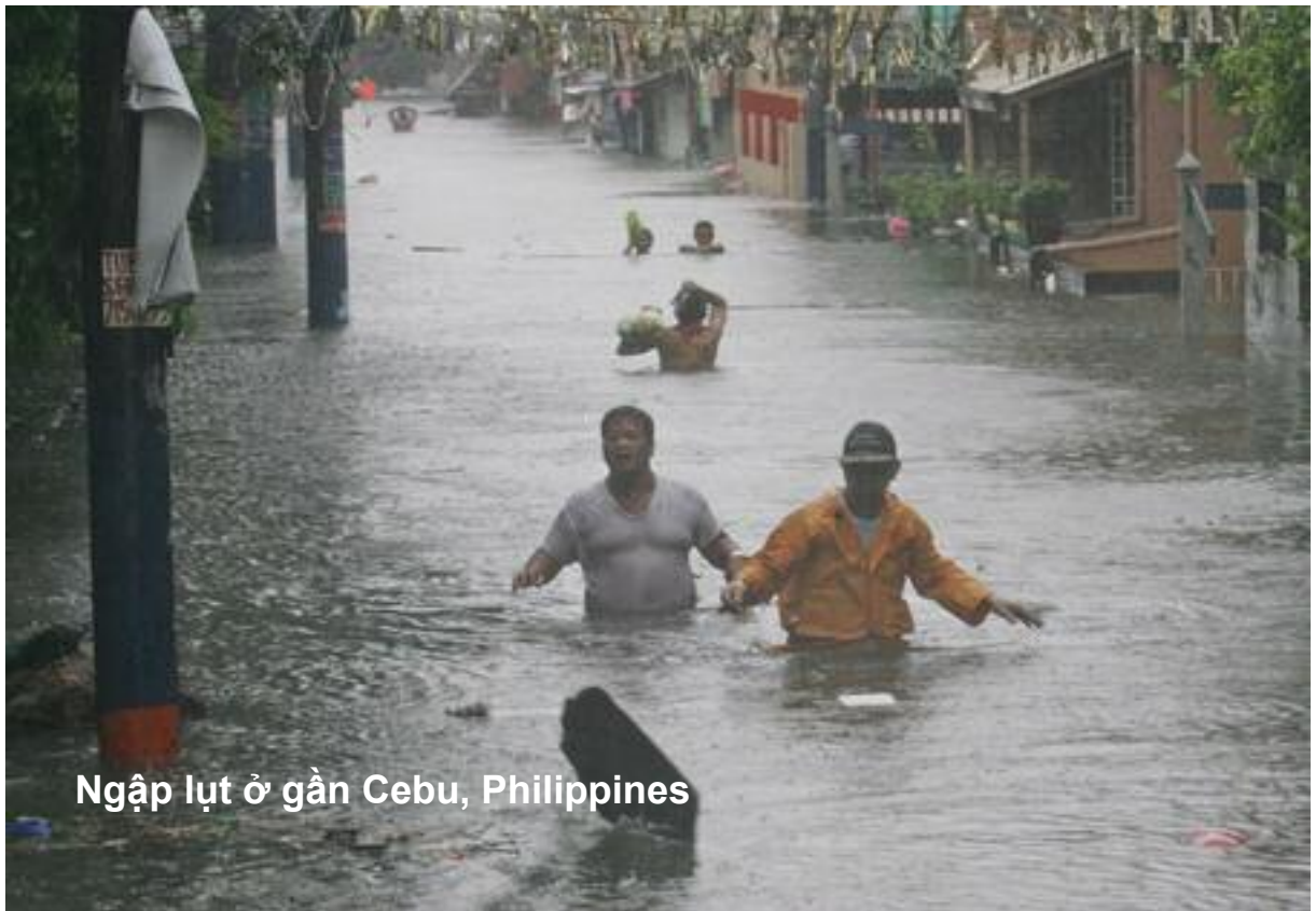
Ngập lụt ở gần Cebu, Philippines