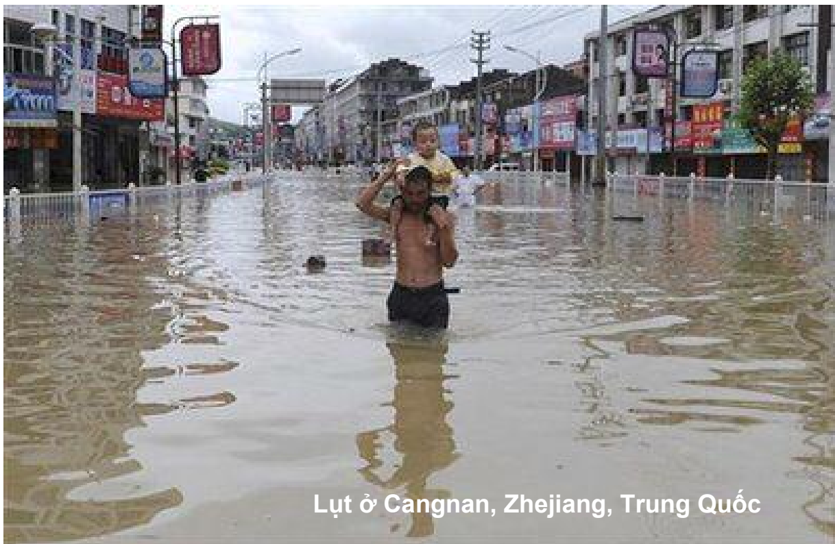
Lụt ở Cangnan, Zhejiang, Trung Quốc