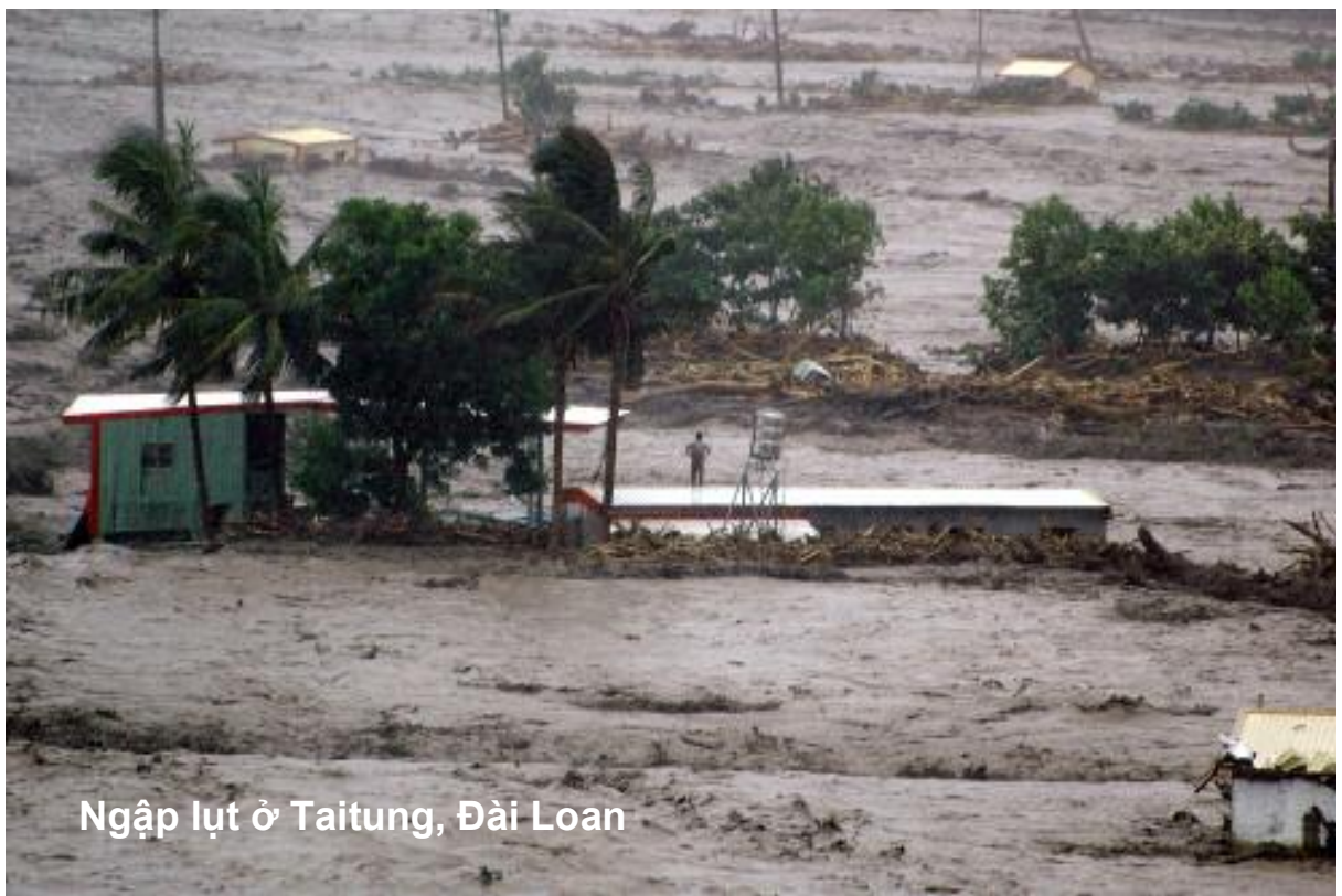
Ngập lụt ở Taitung, Đài Loan