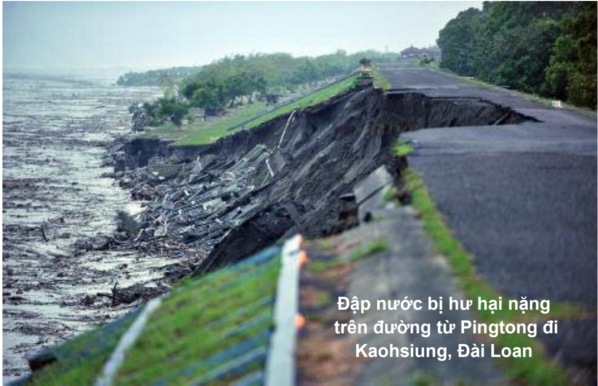
Đập nước bị hư hại nặng trên đường từ Pingtung đi Kaohsiung, Đài Loan